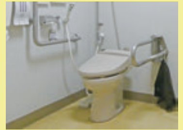
▲多目的トイレは、入って左。オストメイト対応です。

信楽産業展示館では、伝統的な信楽焼から若手作家の新しい信楽焼まで数多く取り揃えております。また、信楽焼・信楽町について、可能な限り、なんでもお答えさせていただきます。お気軽にお尋ねください。