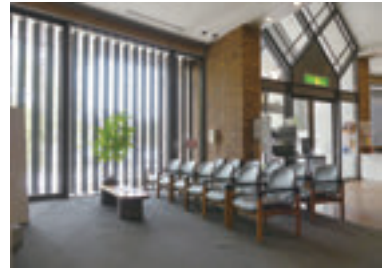
▲ショップ&インフォメーション