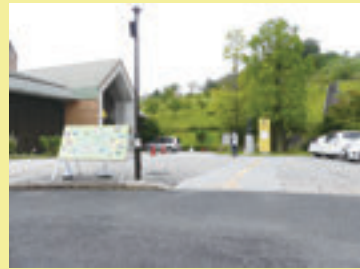
▲駐車場から入口までのアプローチは、ほぼフラットで、入口は自動ドアです。