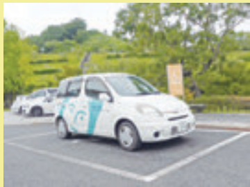
▲身障者用駐車場は、建物すぐ横にあります。