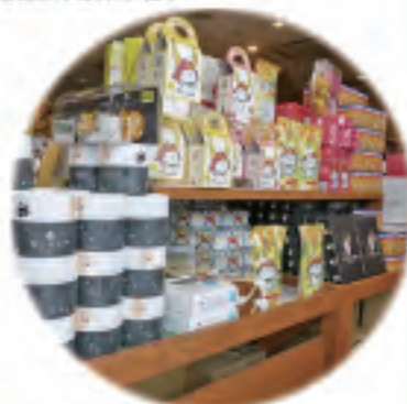
滋賀の人気ゆるキャラグッズも・・・