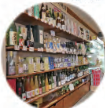
近江の蔵元の地酒がずらり