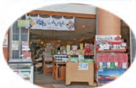
滋賀の銘菓・地元産のお茶など。