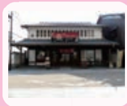
ベーカリーカフェ脇本陣