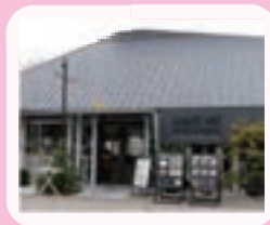
SUNDAY'S BAKE RIVER GARDEN サンデーズベイク リバーガーデン