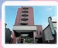
アーバンホテル草津