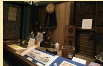
幕末の草津宿の模型や旅の道具、道中記類などの資料も展示（2階）