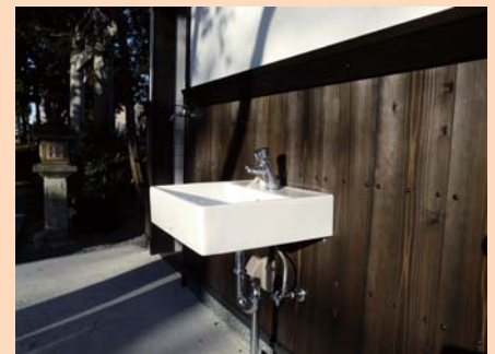
水道は外側の通路にあります。シンク下があいていて車いす等で使いやすい。