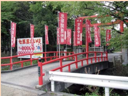
入口は、勾配のきつい太鼓橋になっています。