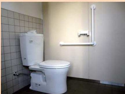
左側にL字手すりが設置されています。