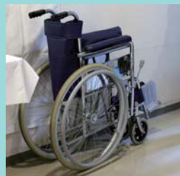
見学用の常設車いす