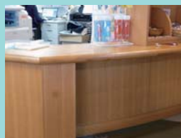
低めの受付カウンター