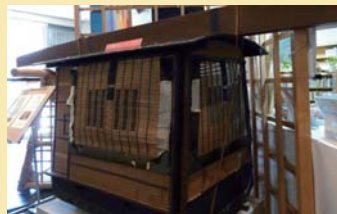
1階エントランスには、よく時代劇などに出てくる駕籠が展示されています。