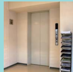
車いす対応エレベーター