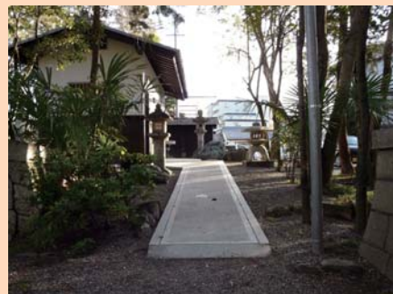
お手洗いに向かって左にスロープがあります。