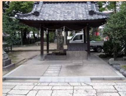
手水舎には、スロープが設置されています。