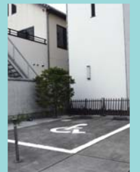
車いす用駐車場は建物裏手にあります