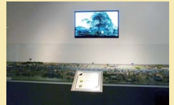
スマートフォンやタブレットを使えば、弥次さんと喜多さんの解説が聞けます。