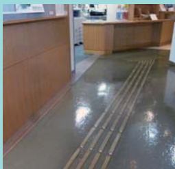
入口から受付までの点字ブロック